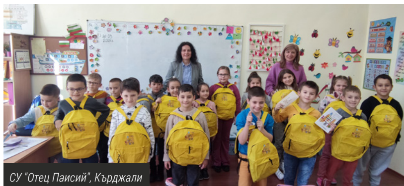
СУ "Отец Паисий", Кърджали

дейността на банката в момента и представи два продукта – Digital Me и MyFin. Децата се включиха активно в урока, задавайки много любопитни въпроси.